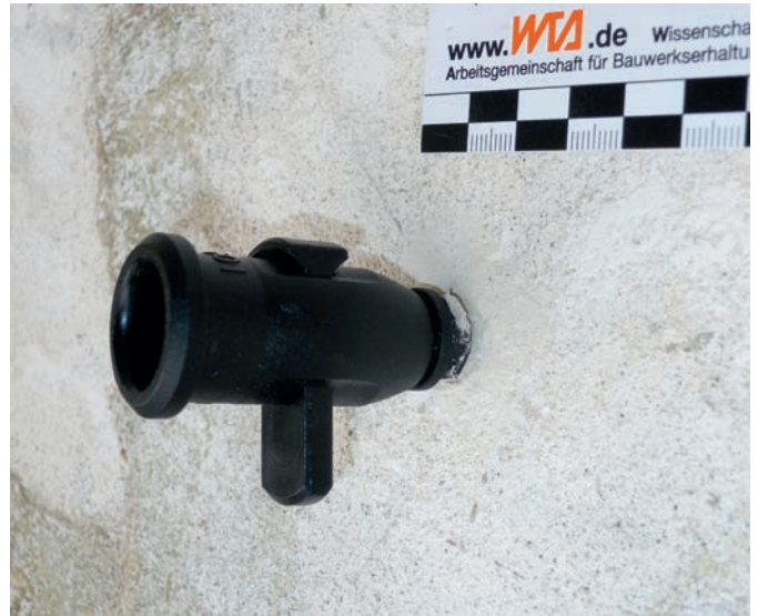
Verschlussstück im Mauerwerk