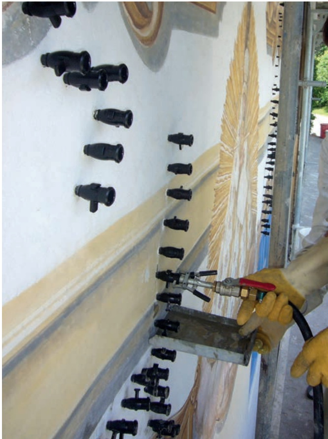
Rissinjektion am Freskenhof

Besondere Aufmerksamkeit und eine interdisziplinäre Zusammenarbeit benötigen die Erhaltung und Sanierung von Baudenkmalen. Solche Objekte sind wichtige Zeugnisse menschlicher Kultur, hier zum Beispiel über russisch-französische Handelskultur im 18. Jahrhundert mit Besonderheiten im Inneren wie einer Hauskapelle, reichhaltig bemalten Türen und wertvollen Fayence-Öfen. Darüber hinaus stellen historische Mauerwerke einen besonderen Wert im Bezug auf Nachhaltigkeit und qualitativ hochwertiger Naturbaustoffe dar, die im Verhältnis zu heutigen Baustoffen oft wesentlich wertvoller als diese sind. Ihr Erhalt hat somit nicht nur einen ideellen, sondern auch einen qualitäts- und werterhaltenden Aspekt, der heute gerne zugunsten rationellerer Baumethoden außer acht gelassen wird.