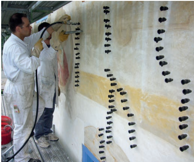
Anordnung der Schlagpacker